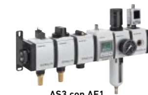
AS3 con AF1

I nostri componenti forniscono aria compressa per ogni applicazione. I gruppi di trattamento aria della famiglia AS possono essere usati in tutte le situazioni dove sono richieste portate da 1.200 a 14.500 l/min, potendo contare su affidabilità e facilità di configurazione.